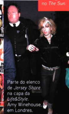
Parte do elenco de Jersey Shore na capa da Life & Style . Amy Winehouse, em Londres.