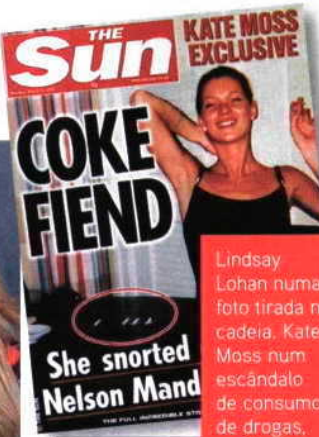
Lindsay Lohan numa foto tirada na cadeia. Kate Moss num escândalo de consumo de drogas, no The Sun .